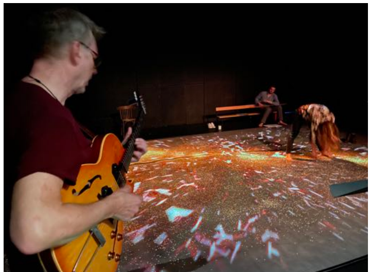
photos de répétition mars 2022 TNP / Villeurbanne